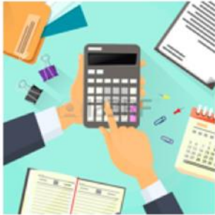
1. RECOPIRAR Y ANALIZAR